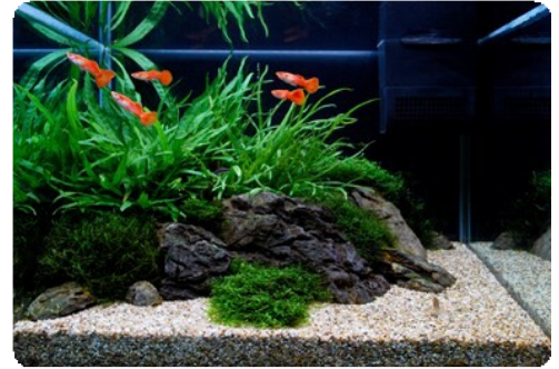
von James Starr-Marshall